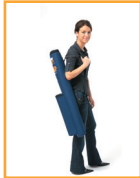
Étui de transport souple de recharge