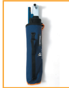
Malette de recharge